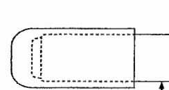
計測位置 (先端から8センチメートル)